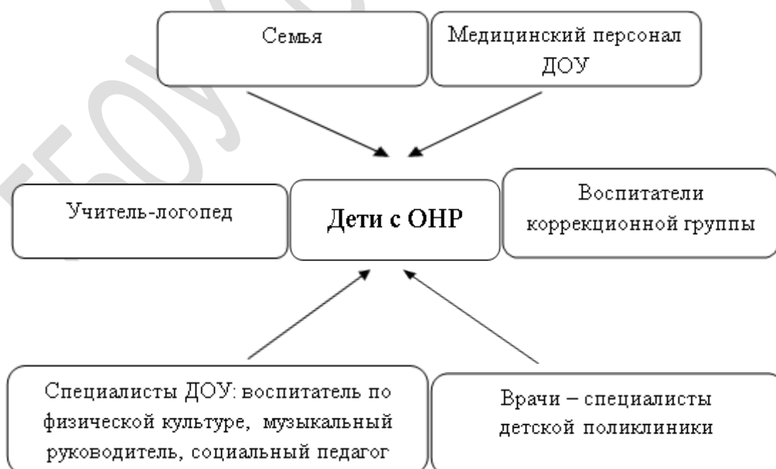
План взаимодействия учителя-логопеда со специалистами ОДОД и родителями воспитанников (Приложение 5)